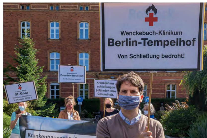
Demo im September 2020 vor dem Wenckebach-Klinikum

Unterschriftensammlungen und Bürgerentscheide zum Erhalt von Kliniken erhielten allein in den letzten fünf Jahren 436.000 Stimmen. Es lohnt sich: Schließungen können verhindert, Privatisierungen zurückgenommen werden. Zusätzlich zum lokalen Widerstand ist die überregionale Vernetzung wichtig, um mehr Druck aufzubauen: in der Aktionsgruppe Stoppt das Kliniksterben in Bayern , in der Initiative Regionale Krankenhausinfrastruktur erhalten in Nordrhein-Westfalen und im Bündnis Klinikrettung auf Bundesebene.