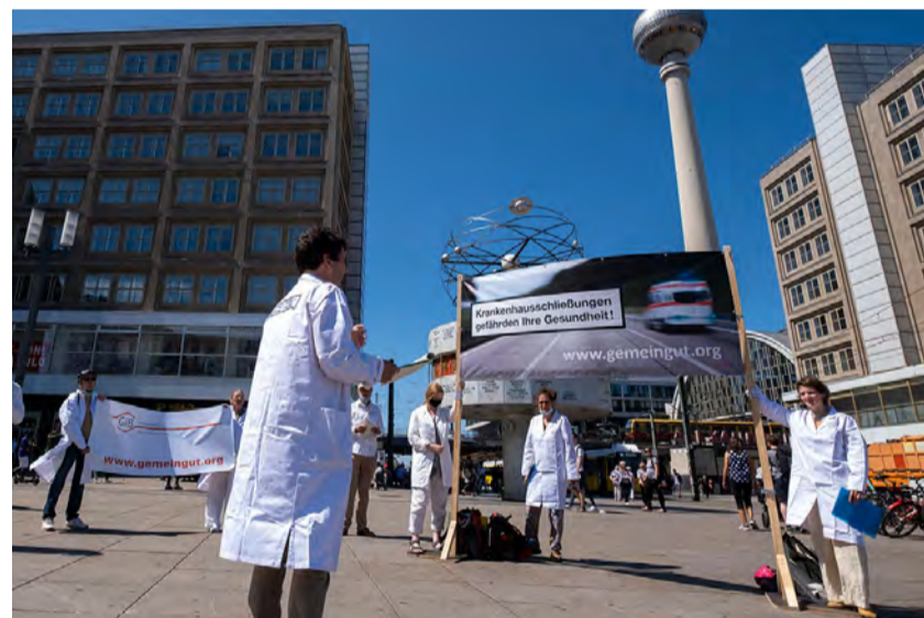
GiB-Aktion auf dem Alexanderplatz am Tag der Daseinsvorsorge

Profite dürfen nicht vor der Gesundheit rangieren. Wir müssen schleunigst zum Grundsatz zurückkehren, dass Gesundheit keine Ware ist. 96 Prozent der Bevölkerung gaben im Juni 2020 an, dass ihnen PatientInnenversorgung wichtiger ist als Wirtschaftlichkeit im Krankenhauswesen.